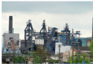
Le patrimoine industriel est un marqueur fort des paysages, principalement dans les vallées (Pont-à-Mousson)