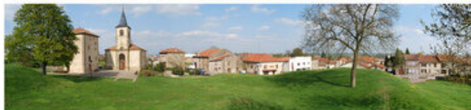
Un aménagement de planter original à Ligny, adapté au contexte rural et ouvert sur l'espace public de l'ancienne mairie (Jardin)