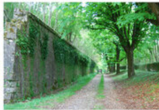
Les forêts, parfois immergées dans la végétation, constituent un héritage culturel remarquable (Toul)